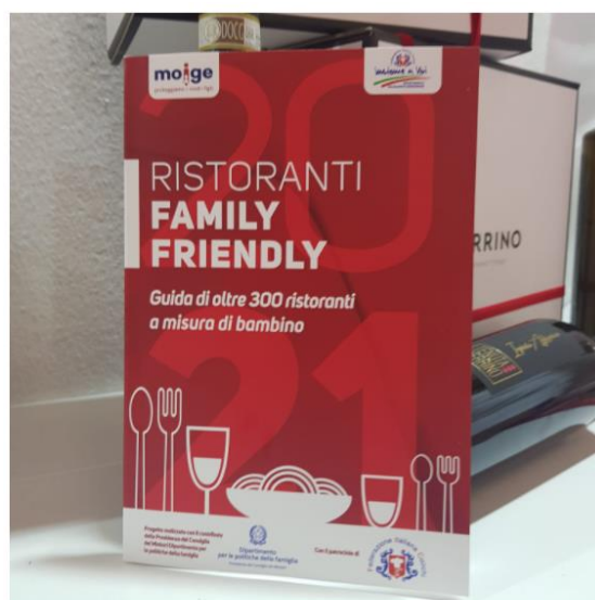
MOIGE guida ristoranti Family Friendly

Oltre 300 locali selezionati da MOIGE e Dipartimento Solidarietà Emergenze della Federazione Italiana Cuochi con il contributo del Dipartimento per le Politiche della Famiglia