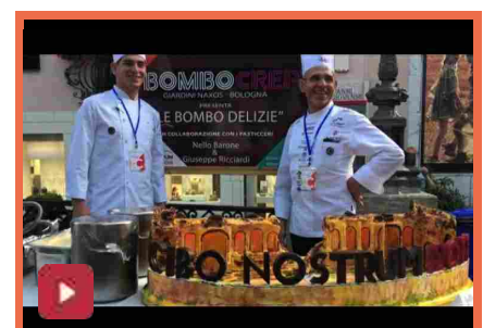
A Taormina va in scena Cibo Nostrum : 1000 chef cucinano in strada