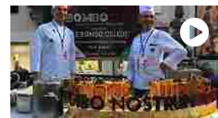
A Taormina va in scena Cibo Nostrum: 1000 chef cucin... strada