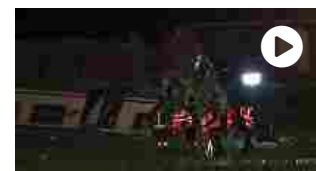
Treno contro tir nel Torinese, 2 morti e diversi feriti