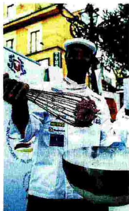
Non solo sapor. Riflettori accesi anche sulle strategie dell'agroalimentare

Il MipAAF parteciperà alla manifestazione — che sarà occasione per attrarre l'attenzione del grande pubblico nell'ambito di un contesto culina-