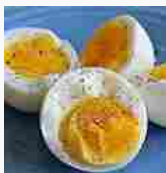
15 Trucchi e rimedi della nonna per dimagrire in fretta (La Casa Facile)