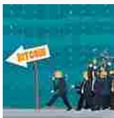
Prezzo Bitcoin scende. Migliaia di Italiani ne approfittano (newsdiqualita.it)