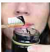
Denti bianchi? Ecco come fare (Benessere Lab)