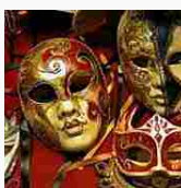
Trucco occhi e mascherina Carnevale