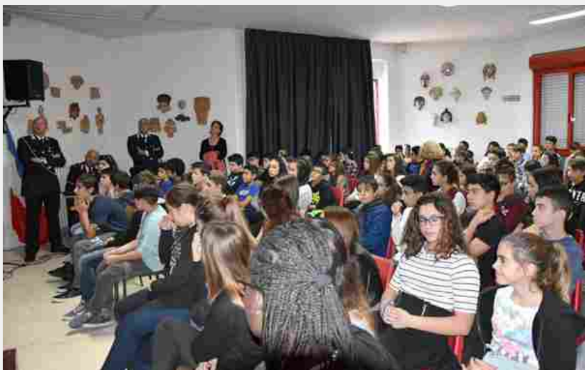
Gli alunni della scuola media di viale Marconi impegnati nel progetto

Iniziativa nella scuola di viale Marconi, a Oristano