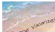
L'ORAFO ITALIANO VI AUGURA BUONE VACANZE! Articolo simile