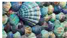
Happy holidays from l'Orafo Italiano In "l'Orafo Italiano"