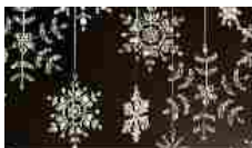
L'Orafo Italiano vi augura buone feste In "2016"