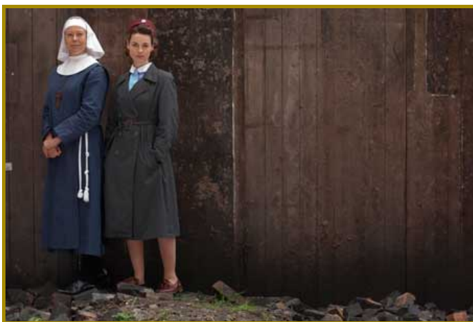
"Call the midwife"

Assegnati "Premi Tv Moige", i riconoscimenti destinati ai prodotti televisivi 22 programmi e 6 spot family friendly. Sul fronte "Fiction, Serie tv e Soap opera" Rai e Mediaset hanno ottenuto 5 premi su 6 della categoria: per Rai1 premio Moige alla miniserie "Sotto Copertura"; alla fiction "Io non mi arrendo" e al film "Il sindaco Pescatore". Per quanto riguarda Mediaset, Italia 1 si aggiudica un premio Moige con "The Flash", e La5 con