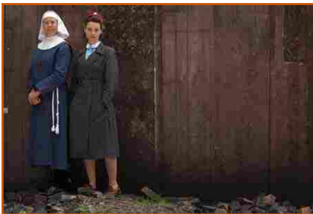
"Call the midwife"

Assegnati "Premi Tv Moige ", i riconoscimenti destinati ai prodotti televisivi 22 programmi e 6 spot family friendly. Sul fronte "Fiction, Serie tv e Soap opera" Rai e Mediaset hanno ottenuto 5 premi su 6 della categoria: per Rai1 premio Moige alla miniserie "Sotto Copertura"; alla fiction "Io non mi arrendo" e al film "Il sindaco Pescatore". Per quanto riguarda Mediaset, Italia 1 si aggiudica un premio Moige con "The Flash", e La5 con