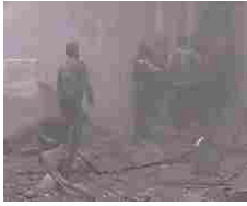
Siria, bomba colpisce una scuola: i bimbi urlano mamma /Video