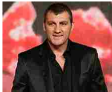
Vieri: "Elisabetta Canalis? Menava di brutto quando la