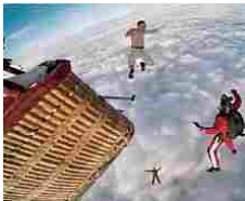
Intrepido, pazzo, folle: giù dalla mongolfiera senza paracadute