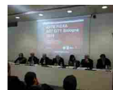
Bologna: Arte Fiera celebra i suoi primi 40 anni e guarda ai giovani