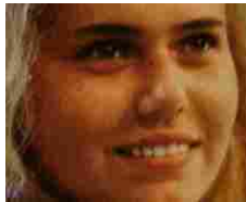
Svolta giallo di Ylenia Carrisi, vicini a soluzione. Al Bano: