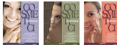
3/2015 2/2015 1/2015