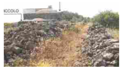
Rustico, Casale Pantelleria loc. Barone - 15625 €

All'Atelier La Lucciola (via Narciso Cozzo 9) alle 18,30 "Peppi il disgraziato" di e