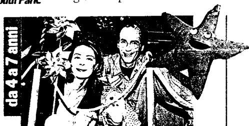
L'Albero azzurro Raitre