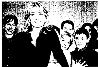
Gt Ragazzi Raiuno