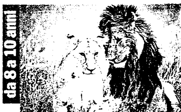
Geo & Geo Raitre