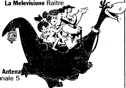
Gli Antenati Canale 5