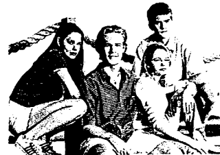
Dawson's Creek Italia 1