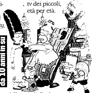
I Simpson Italia 1

un divertente programma americano che stimola adulti e bambini a parlare insieme anche di argomenti seri». Con l'aiuto degli esperti, ecco una guida alla tv dei piccoli, età per età.