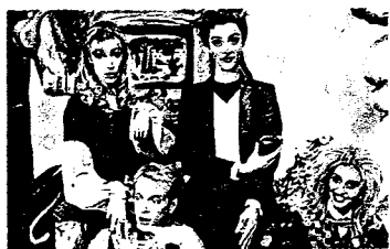
La Melevisione Raitre