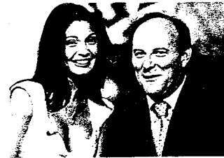
Passaparola Canale 5