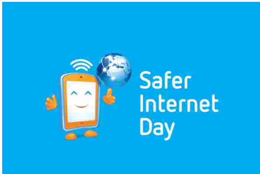
Safer Internet Day 2016, tutte le misure adottate da Google per un uso responsabile della rete

Safer Internet Day 2016 , la quinta edizione della "Giornata mondiale di sensibilizzazione all'utilizzo sicuro e responsabile di internet", si è svolta ieri in tutto il mondo. Proprio per questa occasione, Google ha svelato diverse misure che verranno adottate in futuro, volte a rinforzare la sicurezza degli utenti. Crittografia dei messaggi, verifica dei parametri e pulizia del Google Play Store sono in programma per il futuro.